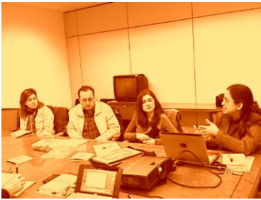
Comisión Permanente Española Noviembre 2010

La sede de la AECID en Madrid acogió el pasado 23 de noviembre la última reunión de la Comisión Permanente española con la presencia del Ministerio de Medio Ambiente y Medio Rural y Marino, la AECID, el Centro de Nuevas Tecnologías del Agua de Andalucía (CENTA), el Ayuntamiento de Zaragoza, la Campaña del Milenio de Naciones y el Secretariado de la Alianza por el Agua.