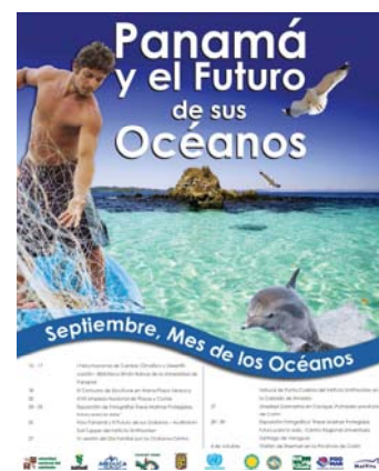
Afiche del evento.

Más información: mesdelosoceanos09@yahoo.com