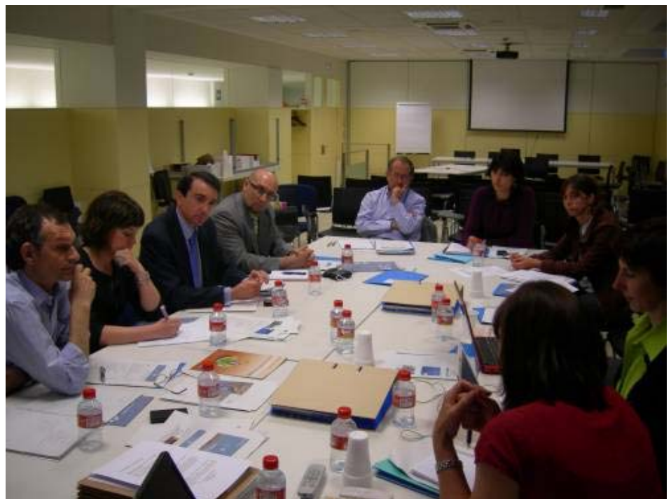
Reunión de la Comisión Permanente española en mayo de 2009.

Los asistentes a la reunión recibirán en los próximos días la Agenda del Día detallada y la documentación que se manejará durante la reunión.