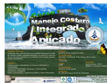
Volante del curso.

Más información: hgarces@umip.ac.pa , icasas@umip.ac.pa , y www.umip.ac.pa .