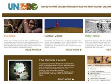
Portada de la web del Decenio unddd.unccd.int