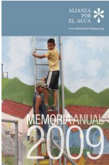
Portada de la Memoria 2009