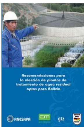
Portada del libro Recomendaciones para la elección de plantas de tratamiento de agua residual aptas para Bolivia