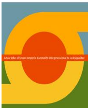
Portada del Informe Regional sobre Desarrollo Humano para América Latina y el Caribe 2010